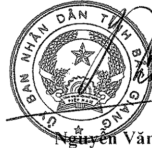
Nguyễn Văn Linh